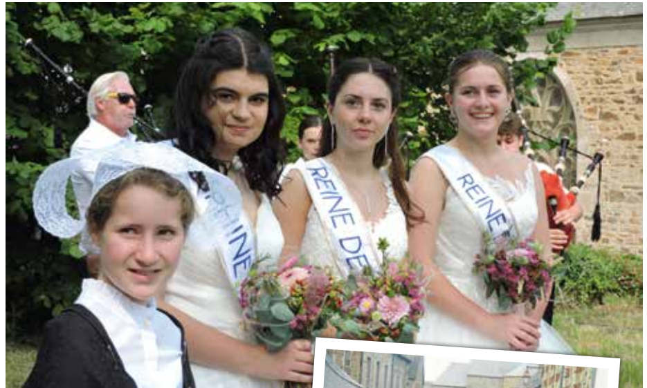
(Manon Rault, 2 ème dauphine, ab- sente sur la photo cause obligations professionnelles)