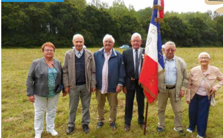
26 juillet 2023, délégation goudelinaise à la Saudraie en Plélo

Pour vous-même et tous ceux qui vous sont chers, les responsables du comité FNACA de Goudelin vous présentent leurs meilleurs souhaits pour 2024.