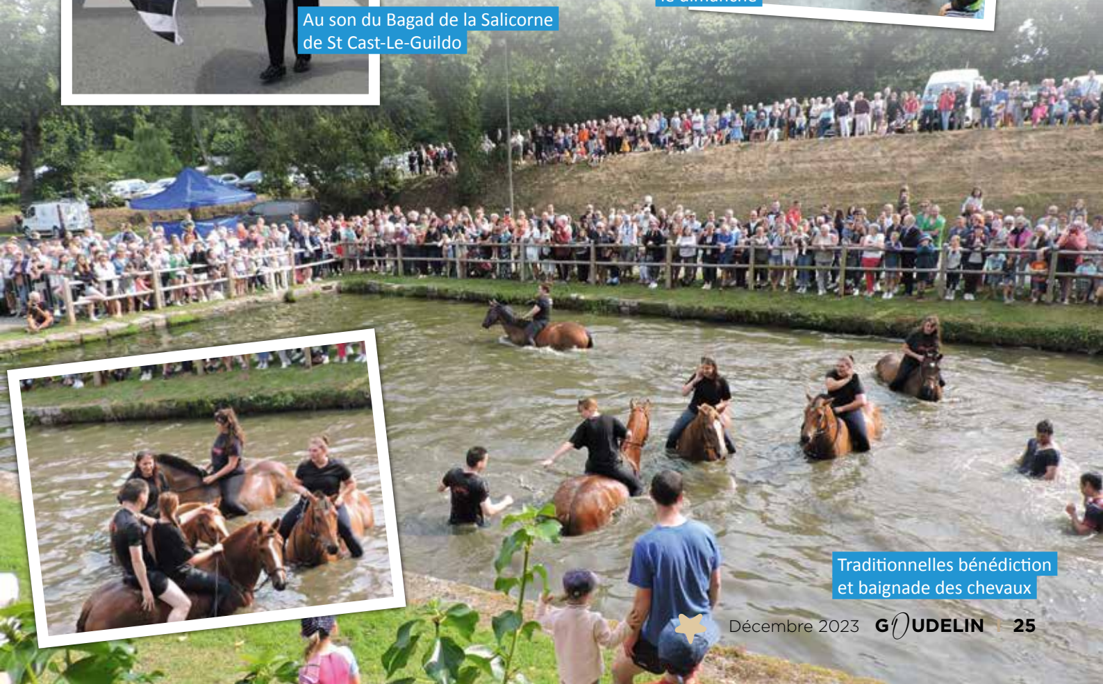
Traditionnelles bénédiction et baignade des chevaux