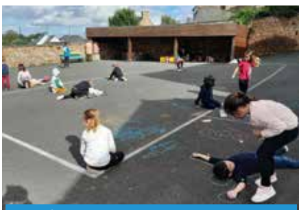
Jeux à la craie dans la cour le midi....

La veille des vacances, dans la classe de CE1-CE2, on révisé tout ce qu'on a appris en maths et en français sous forme de jeux de jeu de société. C'est tellement plus amusant de travailler en jouant !