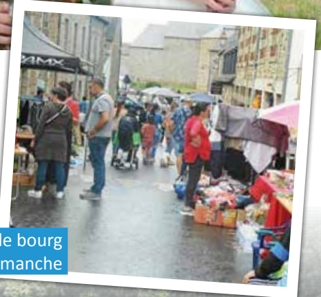
Brocante dans le bourg le dimanche