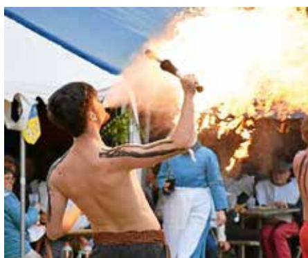
Le spectacle des cracheurs de feu est toujours impressionnant