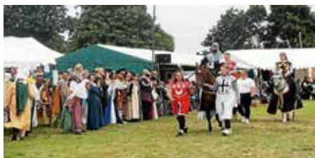
Cavaliers et montures défilent devant les seigneurs et les spectateurs